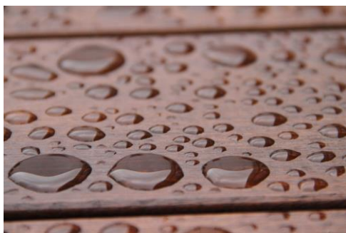
Effet perlant avec Saturateur bois

« Nous sommes très satisfaits de la qualité du service fourni par VM qui nous a accompagné et conseillé, tout en respectant nos impératifs. Tout d'abord nous souhaitons une solution la plus écologique possible. Et nous avons besoin que la terrasse soit terminée avant l'ouverture de la saison. La réactivité partagée des équipes VM et BLANCHON s'est révélée efficace. Un ingénieur technique s'est même assuré que les solutions soient adaptées en effectuant des tests sur échantillon. Comme nous l'avions demandé, une note détaillée sur l'entretien nous a été fournie. Nous avons par la suite fait à nouveau appel à VM AYTRÉ BOIS pour nos serrures ou encore l'entretien des menuiseries, et bientôt pour le traitement de nos bardages. », conclut THIERRY MARCHAND, Responsable entretien chez LÉA NATURE.