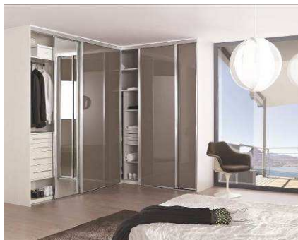
Dressing COULIDOOR Disponible dans les points de vente VM