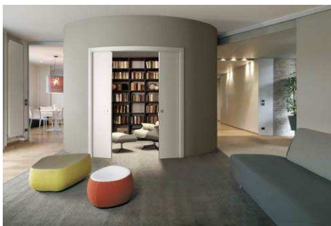
Bloc porte ECLISSE Disponible dans les points de vente VM

Équipement fonctionnel par excellence, l' escalier devient un objet de décoration qui signe l'identité de l'habitat. En colimaçon, suspendu, droit ou hélicoïdal, VM présente des solutions sur-mesure ou standard, design ou classiques .