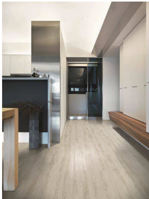
Revêtement de sol vinyle WICANDERS Disponible dans les points de vente VM

Le liège naturel allie propriétés acoustiques, biomécaniques, thermiques et facilité d'entretien. Bénéficiant des avantages de ce matériau afin de créer confort, chaleur et atmosphère paisible, ces collections présentent le réalisme d'un sol bois et des décors en pierre .