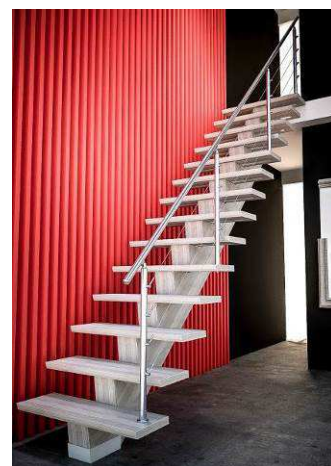
Escalier SOGEM Disponible dans les points de vente VM

Au-delà de l'outil, VM accompagne le client, professionnel ou particulier, dans son projet . Facilitateur de mise en relation grâce à ses artisans partenaires, il conseille à chaque étape, de la conception à la réalisation. Il propose des services de livraison adaptés et un maximum de produits disponibles immédiatement.