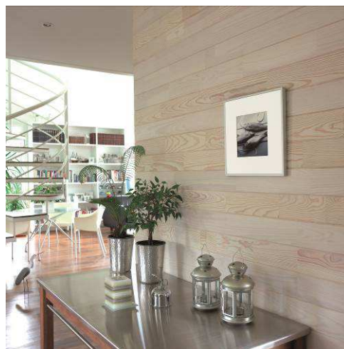
Lambris VERNILAND Disponible dans les points de vente VM

Brut ou décoratif, le lambris constitue une alternative au papier peint et à la peinture. Le catalogue référence deux essences pour le bois : Pin et Sapin. Ils sont également proposés en support MDF, composé d'un mélaminé recouvert d'un papier décor et en PVC adapté aux pièces d'eau . De nombreuses largeurs et finitions sont disponibles pour créer des effets de profondeur. Entre couleurs douces et vitaminées (fraise, mandarine, anis, fusion, lin...), il habille les murs au gré des envies et des goûts.