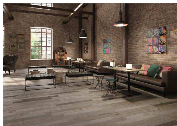
Carrelage aspect bois Disponible dans les points de vente VM