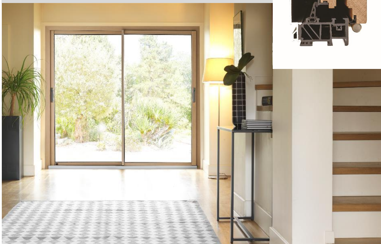
Fenêtre SO! décoration intérieure - 2 150 x 2 400 mm

Prix de vente public conseillé : 2 597 € TTC