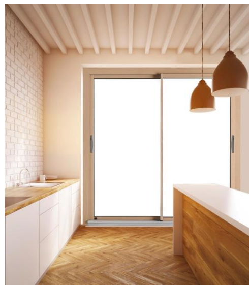
Fenêtre SO! décoration intérieure - 2 150 x 2000 mm Prix de vente public conseillé : 2 406 € TTC

Le bois fait un retour en grâce dans les intérieurs des maisons. Une tendance que le réseau d'installateurs Solabaie® a pris en compte il y a déjà quelques années avec le développement de sa collection de fenêtres, coulissants, châssis fixes, et portes-fenêtres SO!. Entièrement personnalisable, elle offre 500 combinaisons décoratives possibles en intérieur dont quatre finitions : en Chêne lasuré, Chêne blanchi, Chêne brut à peindre, et Pin lasuré. La noblesse de ces bois s'invite ainsi dans les habitats les plus modernes, apportant chaleur et clarté. Elle constitue également une réponse pour préserver l'authenticité des appartements haussmanniens et des demeures d'époque rénovées.