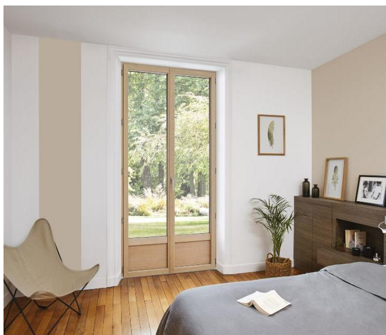
Fenêtre SO! décoration intérieure - 2 150 x 1200 mm Prix de vente public conseillé : 2 198 € TTC

Quelle que soit la pièce à vivre, Solabaie® rend au bois ses lettres de noblesse. Esthétiques et fonctionnelles, les fenêtres SO! en Chêne ou Pin confèrent un charme naturel... à la française ! Le client a la possibilité de conserver le coloris d'origine ou d'opter pour une autre couleur en choisissant le Chêne brut à peindre.