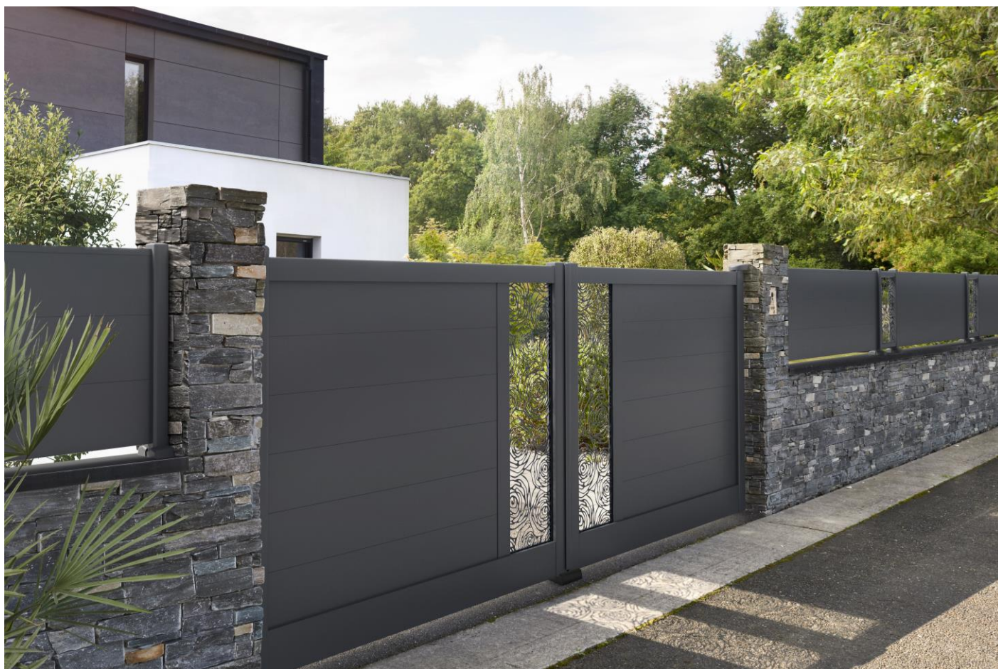
Portail PETREL de CHARUEL (aluminium noir 2100 sablé, tôle perforée motif Roses, ouverture battante) - Crédit photo : STUDIOS GARNIER