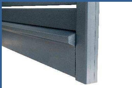
Soubassement en ciment