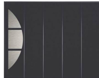
Ward - Atlantem