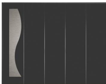
Luna - Atlantem