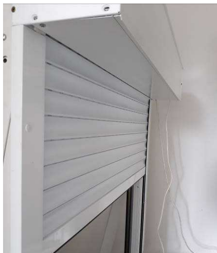
Volet roulant ATLANTEM

ATLANTEM n'attend pas l'avènement de la maison et des objets connectés annoncé pour 2020 pour rendre toutes ses gammes compatibles. Volets roulants, portails et portes de garage motorisés sont ainsi déjà fournis « en standard » avec ce type d'équipement. Totalement repensé, son catalogue 2018 « VOLETS ROULANTS » de 34 pages confirme cette volonté de se positionner comme un spécialiste de la smarthome . Il franchit un nouveau cap et intègre, à l'ensemble de ses solutions de volets roulants « rénovation », « traditionnel », « tunnel », « bloc baie » et « rénovation ouverture sous face », un nouveau système de motorisation solaire pour la maison connectée. Son offre de couleurs, composée de quinze coloris, s'élargit avec deux nouveaux gris (RAL 9006 et RAL 7022).