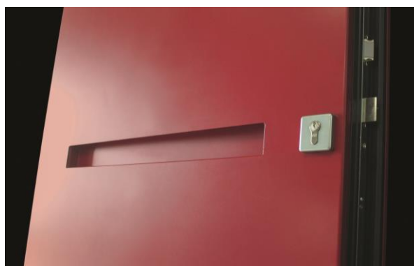
POIGNÉE DE TIRAGE INTÉGRÉE LAQUÉE ROUGE

100 % harmonie, telle est la devise de ces cinq nouveautés qui se dotent d'une poignée laquée de la même couleur que la porte. Ces modèles contemporains affichent un design épuré, relevé tantôt par une poignée en saillie pour un effet relief, tantôt une poignée intégrée dans l'épaisseur du vantail pour un style minimaliste.