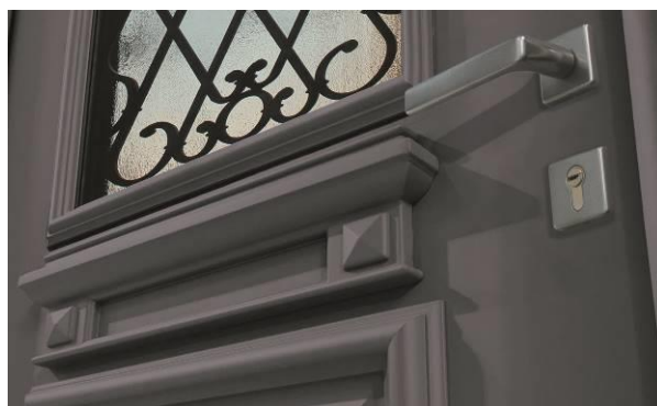
MOULURATION RAPPORTÉE 2 FACES, CIMASE ET JET D'EAU EXTÉRIEUR

Maisons de campagne, vieilles demeures, villas au cachet rustique... pourront s'habiller de trois nouveaux modèles classiques dont les moulures massives rapportées rappellent les anciennes portes en bois. Ils se déclinent en grand vitrage pour adoucir les lignes ou avec des grilles intégrées au vitrage pour renforcer le style authentique.