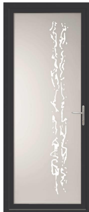
GAMME VISION, MODÈLE FLOYD

Le vitrage des portes VISION est équipé en standard d'une couche ITR améliorant les performances thermiques de la porte d'entrée. Elles présentent un coefficient U_d = 1,5 \text{ W/m}^2\text{.K} pour un ouvrant aluminium à rupture de pont thermique, U_d = 1,3 \text{ W/m}^2\text{.K} pour un ouvrant PVC 100 % fibré, et U_d = 1,5 \text{ W/m}^2\text{.K} pour un ouvrant bois de 57 mm.