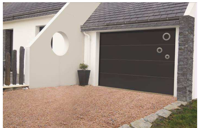
Modèle KORAB de VENDÔME

VENDÔME a conçu sa nouvelle gamme de portes de garage sectionnelles à traction ATTRACTIVE pour diversifier le choix des artisans à la recherche d'une solution simple à mettre en œuvre. Idéale en rénovation, la rapidité de pose de ce type de porte est également appréciée pour une construction neuve. Ces modèles sont disponibles en dimensions standards ou sur-mesure. Ils peuvent atteindre une hauteur de 2,25 mètres et une longueur de 3,5 mètres, s'adaptant à la majorité des chantiers.