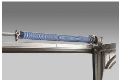
Ressort laqué poudré

Robuste et silencieux , le système de levage est associé à ces ressorts qui assurent également l'équilibrage de la porte durant son fonctionnement. Un confort quotidien pour les utilisateurs !