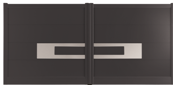
SOLABAIE - Les Coordonnés - Portail Houston

Les portails SOLABAIE® sont fabriqués par assemblage mécanique, avec une finition haut de gamme sur-mesure. Modèles, couleurs, accessoires et système d'ouverture battant ou coulissant sont définis en harmonie avec les portes d'entrée et de garage. Pratique, un portillon peut être intégré pour faciliter l'accès aux piétons. Synonymes de confort, les types de motorisations proposés simplifient l'utilisation grâce à une ouverture à distance à l'aide d'une télécommande.