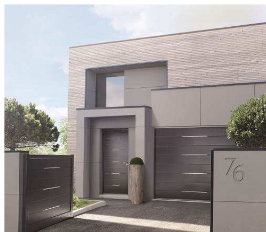
SOLABAIE - Les Coordonnés

Accessoires, décorations, couleurs, systèmes de sécurité, portillons, motorisation, technologie connectée..., les choix et possibilités sont multiples !