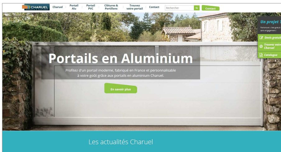
Page d'accueil - DR CHARUEL

Autant d'informations et de services utiles pour accompagner le particulier dans ses choix, dès le début de son projet ! Son format responsive design répond aux attentes de facilité de navigation et de consultation sur tablette et smartphone.