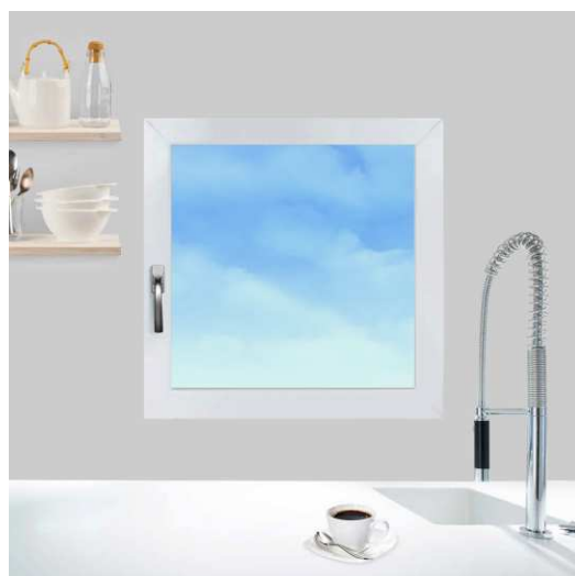
Intérieur blanc