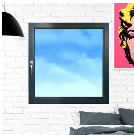
Intérieur couleur