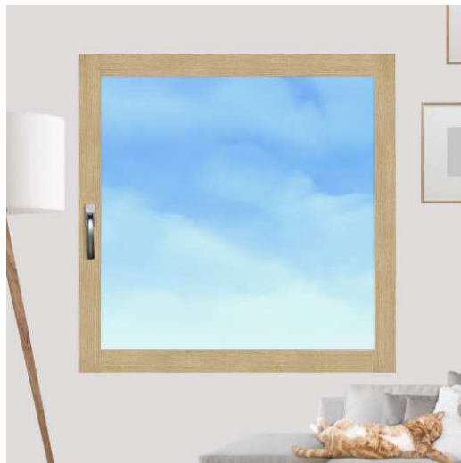
Intérieur bois