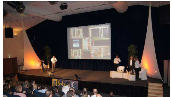
Séance plénière