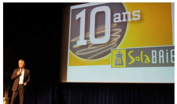
Annnonce des temps forts de 2014

Favorisant des rencontres constructives et encourageant les efforts individuels du quotidien, la manifestation s'est placée sous le signe de la convivialité. Le samedi a été l'occasion de remettre les « Phares d'or » à 12 adhérents SOLABAIE dans quatre catégories : «Meilleur développement en achat de menuiseries ATLANTEM», «Meilleur développement en achat de fermetures VENDÔME», «Nouvelle signalétique de point de vente», les anniversaires des «Cinq ans» dans le réseau. Cette journée a également été dédiée à l'annonce du plan d'animation 2014 du réseau avec en point d'orgue la célébration des 10 ans de SOLABAIE.