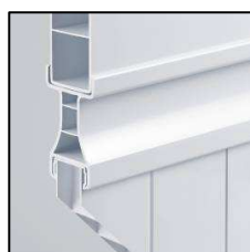
Moulure plate bande