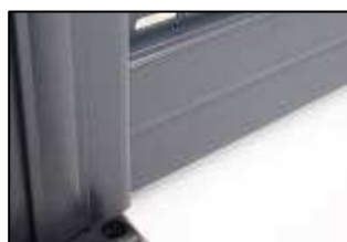
Double traverse basse DR D3 Studio / Studio Océan

Pour simplifier l'installation, tous les accessoires sont fournis. La cartouche de fixation chimique assure un scellement robuste des montants et facilite la pose des gonds dans les murs.