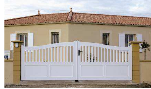
DR D3 Studio / Studio Océan

Ces trois modèles reflètent le savoir-faire historique du fabricant. Ils enrichissent l'offre complète de 180 portails en aluminium et PVC conçus pour le neuf comme la rénovation et pour tous les styles de maisons : de la résidence contemporaine au manoir en pierre de taille. Adaptables à toutes les configurations de terrains, de rues, de jardins et d'accès, ils se déclinent en ouverture battante ou coulissante, et permettent 12 types de poses.