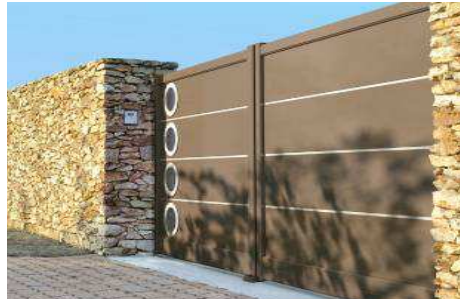
DR D3 Studio / Studio Océan