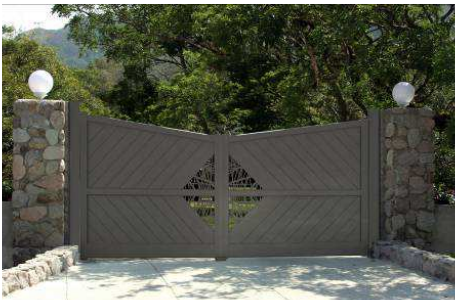
DR D3 Studio / Studio Océan

Prix de vente public indicatif : 2 000 € TTC, pose incluse, sans motorisation