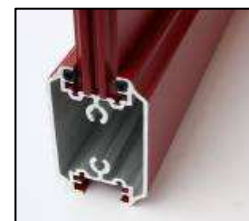
Joint anti-bruit