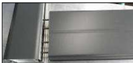
Assemblage mécanique vissé DR D3 Studio / Studio Océan