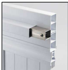
Cadre en inox gainé DR D3 Studio / Studio Océan

Les portails PVC disposent d'un cadre en inox gainé et anti-corrosif qui parfait les finitions esthétiques et double la protection du profilé. La serrure traversante le cadre inox confère une finition supérieure à l'ensemble. En option, VENDÔME développe un profilé exclusif de moulure plate bande qui personnalise et apporte du cachet et du relief au modèle. Tous les gonds et accessoires sont fabriqués en inox pour une durabilité et robustesse optimales. Pour les particuliers qui envisagent de faire évoluer leur système de fermeture, un renfort pour motorisation est systématiquement intégré au portail.