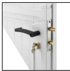
Serrure traversante DR D3 Studio / Studio Océan