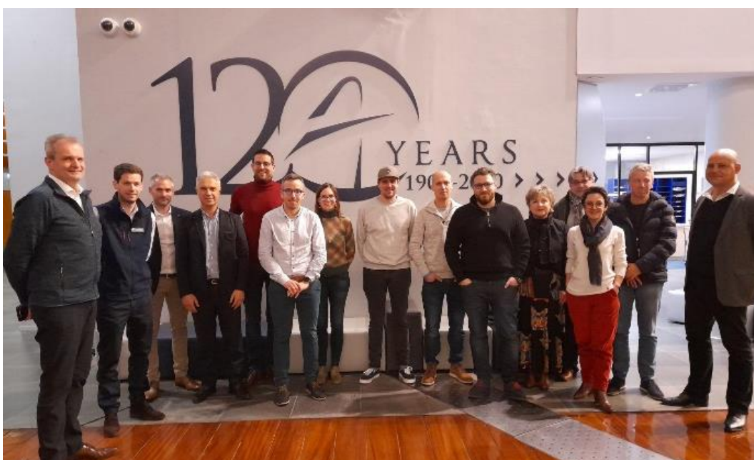
Promotion Parcours Leaders - janvier 2023

Douze managers, issus de toutes les branches du Groupe ont fait partie de la première promotion du parcours Leader intitulé « Transformation et Performance Globale ». Il s'est déroulé en quatre sessions de deux jours pendant quatre mois, en partenariat avec l'école supérieure de commerce nantaise Audencia. Le parcours a été co-construit autour de sujets axés sur la RSE et la stratégie globale, le leadership positif, la performance responsable et durable ainsi que le management et la transformation.