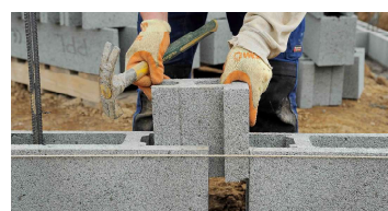
Chantier Vertical Bloc®