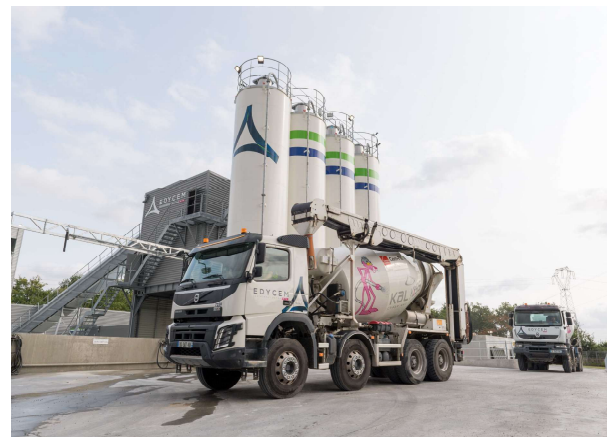
Centrale La Roche-sur-Yon (85)