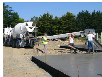
Chantier avec camion-tapis

Visant à améliorer l'accompagnement sur chantier des clients, les camions-tapis proposés par EDYCEM BPE améliorent les conditions de travail des maçons. D'une longueur supplémentaire d'un mètre (2 mètres avec une rallonge) et orientables à 360° par radiocommande, ils permettent également d' obtenir la zone de livraison la plus compacte existante sur le marché , et de maîtriser et simplifier la manipulation du béton prêt à l'emploi.