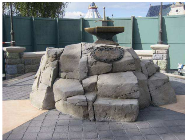
ROCHER CREUX BFUHP - PARC D'ATTRACTION, PARIS DR VM MATERIAUX