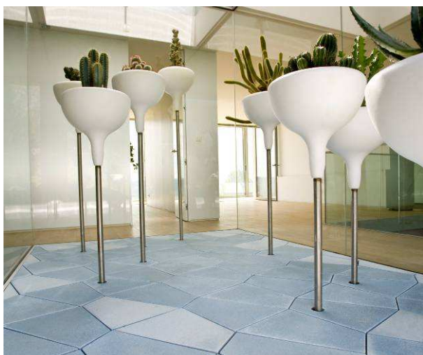
DALLES BÉTON SCINTILLANT - SERRES PASO DOBLE DR PASO NOBLES