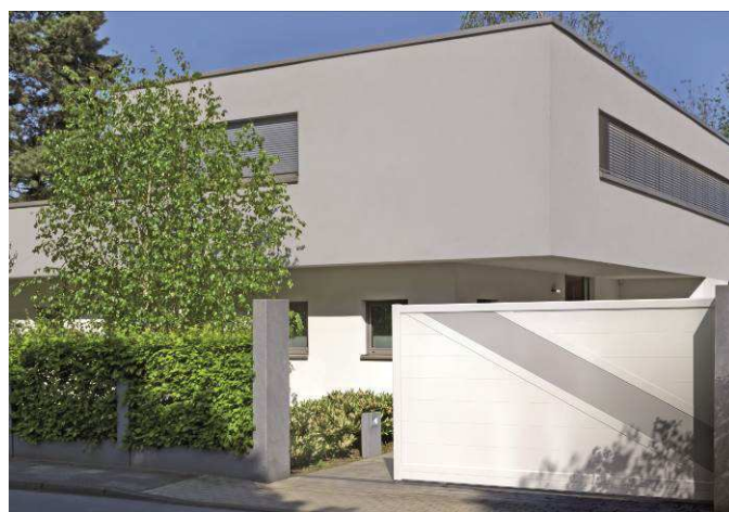
Portail aluminium Vendôme - Modèle Hysope

Les fabricants multi-spécialistes en menuiseries, fermetures et portails ATLANTEM et VENDÔME proposent en standard l'offre de volets, portails et portes de garage connectés la plus large du marché français. Précurseurs, ils anticipent le déploiement de la maison et des objets connectés annoncé à horizon 2020 en intégrant à leurs gammes des solutions de pilotage universelles. Gage de qualité et de fiabilité, ces spécialistes s'appuient depuis cinq ans sur le savoir-faire de SOMFY, un référent dans l'univers de la maison connectée, et de sa technologie IO-HOMECONTROL.