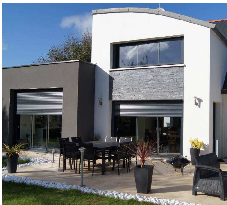
Volets roulants connectés

Ouverture et fermeture à distance, programmation, gestion crépusculaire... En 2016, ils font évoluer leurs solutions et dotent leurs volets roulants du dernier moteur S&SO RS 100 de SOMFY . Complétant la gamme IO, cette technologie devient le nouveau standard silencieux, intelligent et maîtrisant le mouvement. Simple à utiliser et à régler, elle permet à l'utilisateur de « dialoguer » facilement avec les produits tout en gagnant en confort et en sécurité.